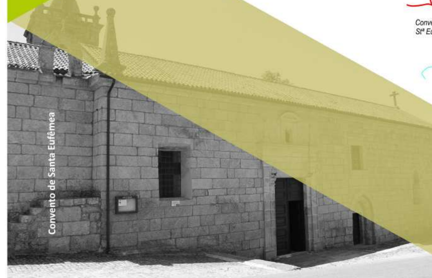
Convento de Santa Eufêmea