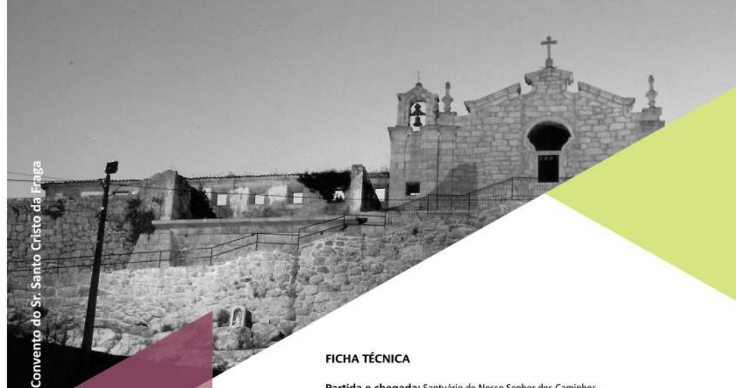
Convento do Sr. Santo Cristo da Fraga